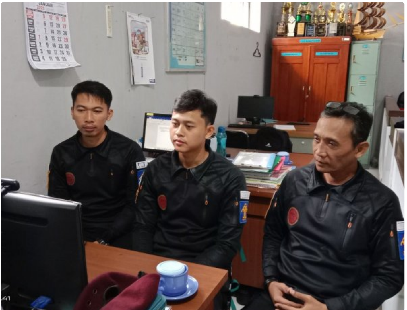
Bangun Harmoni dan Strategi, Lapas Besi Ikuti Webinar Refleksi Akhir Tahun 2024 & Resolusi 2025

CILACAP – Sebagai salah satu langkah dalam pengembangan kompetensi bagi Aparatur Sipil Negara (ASN), Petugas Lembaga Pemasyarakatan Kelas IIA Besi berpartisipasi dalam kegiatan webinar bertajuk "Refleksi Akhir Tahun 2024 dan